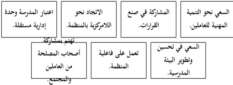
الشكل (١) محددات مفهوم الإدارة الذاتية (من إعداد الباحث)

من خلال العرض السابق يمكن أن نحدد مفهوم الإدارة الذاتية للمدرسة بالمحددات التالية :