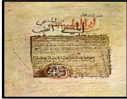
شكل رقم (٧)، الفنان (ضياء العزاوي)، (اشعار'المتنبي)، ١٩٧٧ (٤)

"وعلني المستوي العربي نشاهد وجوها متعددة لهذه العلاقة مثل الرسام والشاعر (جبران خليل جبران) الذي كانت معظم اعماله الفنية هي تجسيد لافكاره الشعرية." (٢) " والفنان العراقي (ضياء العزاوي) الذي استلهم من قصائد الشعر الجاهلي و(المتنبي) و(محمود درويش) (١٩٤١-٢٠٠٨) كما في شكل رقم (٧) وغيرهم. (٣)