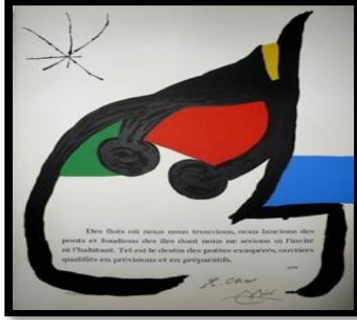
شكل رقم (٦) الفنان خوان ميرو، المؤلف رينيه شار، ١٩٧٦ (١) .

"وعلني المستوي العربي نشاهد وجوها متعددة لهذه العلاقة مثل الرسام والشاعر (جبران خليل جبران) الذي كانت معظم اعماله الفنية هي تجسيد لافكاره الشعرية." (٢) " والفنان العراقي (ضياء العزاوي) الذي استلهم من قصائد الشعر الجاهلي و(المتنبي) و(محمود درويش) (١٩٤١-٢٠٠٨) كما في شكل رقم (٧) وغيرهم. (٣)