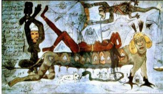
شكل رقم (٨) ، الفنان عبد الهادي الجزار ، عاشق من الجن ، ١٩٥٣ ،

وعلي المستوي المصري نجد الفنان (عبد الهادي الجزار)(١٩٢٥-١٩٦٦) من اوائل فناني مصر الحديثة الذي ربط بعض اعماله بإعمال شعرية (١) ، كما في شكل رقم (٨) .